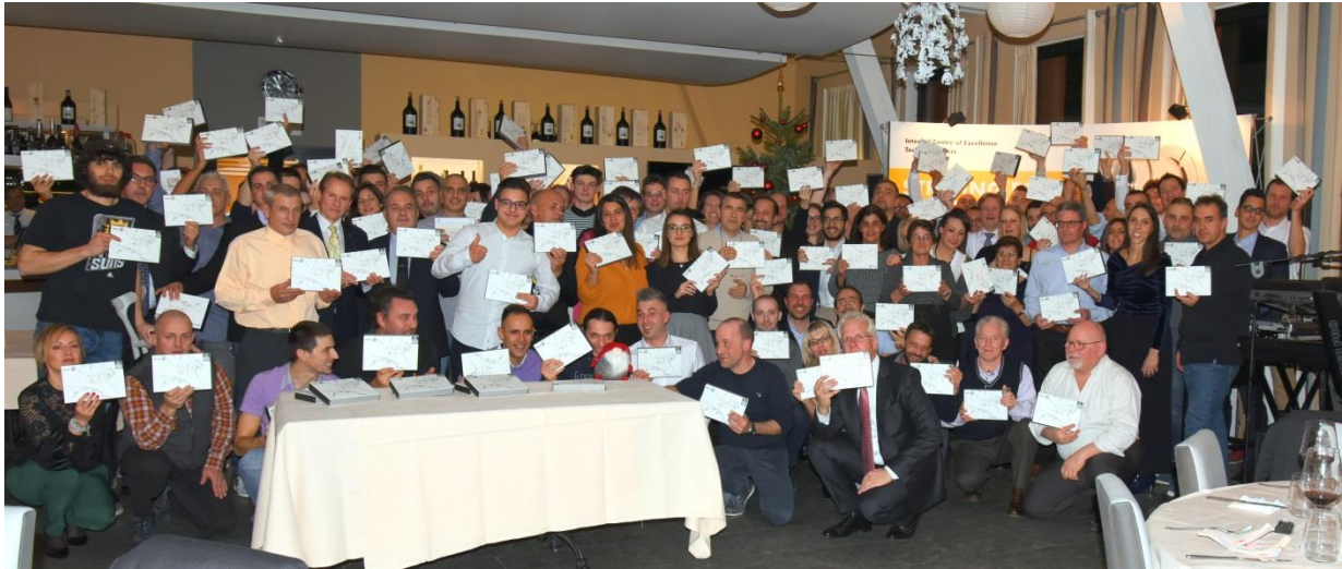
PolioPlus Schokoladenaktivität: Weihnachtsfeier bei Interroll SA im Tessin: Jeder Mitarbeiter erhielt eine PolioPlus-Pralinenschachtel vom Rotary Club Locarno.